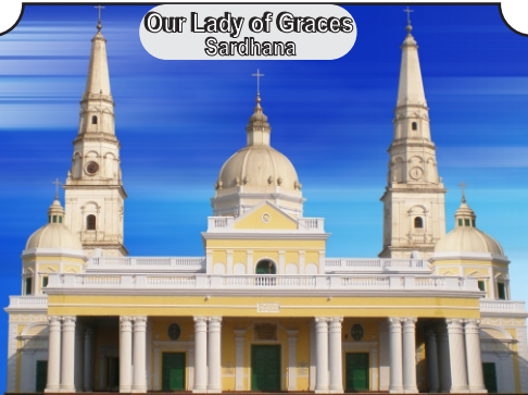
Our Lady of Graces Sardhana

9) Kindly leave the Church Hymn books at Hymn Book trolley in the Church itself.